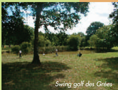
Swing golf des Grées

Le Swing golf des Grées à Rougé. Parcours 10 trous aménagé à l'anglaise dans un cadre préservé. Location de VTT, tir à l'arc et paint-ball pour les groupes. Café jardin et chambres d'hôtes.