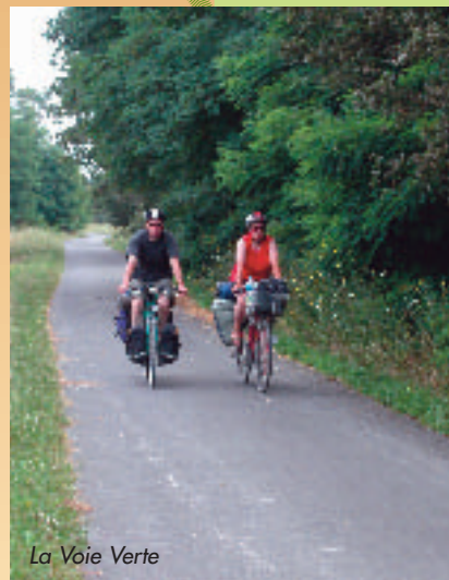
La Voie Verte

Un petite balade à vélo à découvrir dans le calme de la campagne.