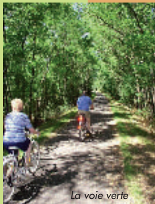
La voie verte

La Voie Verte. Une balade dépaysante au cœur de la campagne Castelbriantaise sur les 13 km de voie aménagée pour la pratique du vélo, du roller et les balades à pied. Départ de Châteaubriant ou de Rougé à 10 km. Rens. à l'Office de Tourisme.