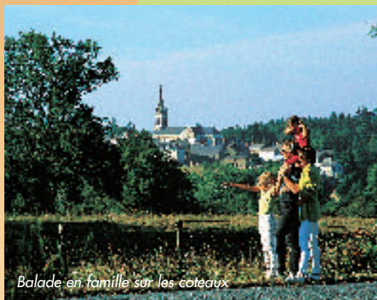
Balade en famille sur les coteaux

Petits villages typiques et belles longères de schistes et de grès ponctuent la promenade au fil des petites routes de