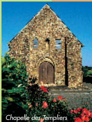
Chapelle des Templiers